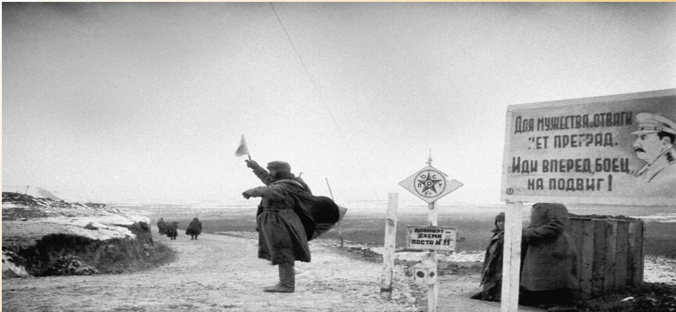
Переправа советских войск через озеро Сиваш