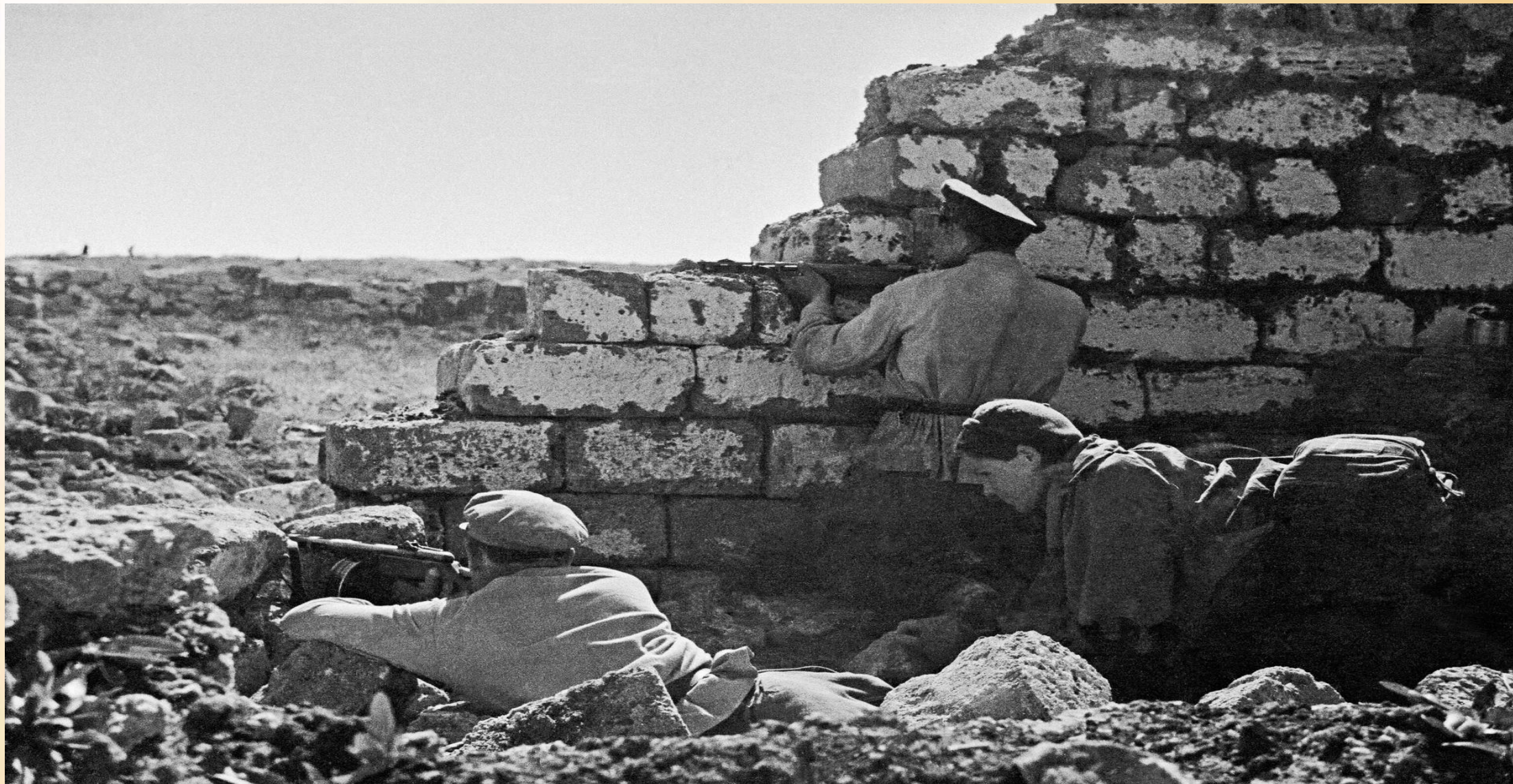
Советские солдаты ведут бои на подступах к Севастополю