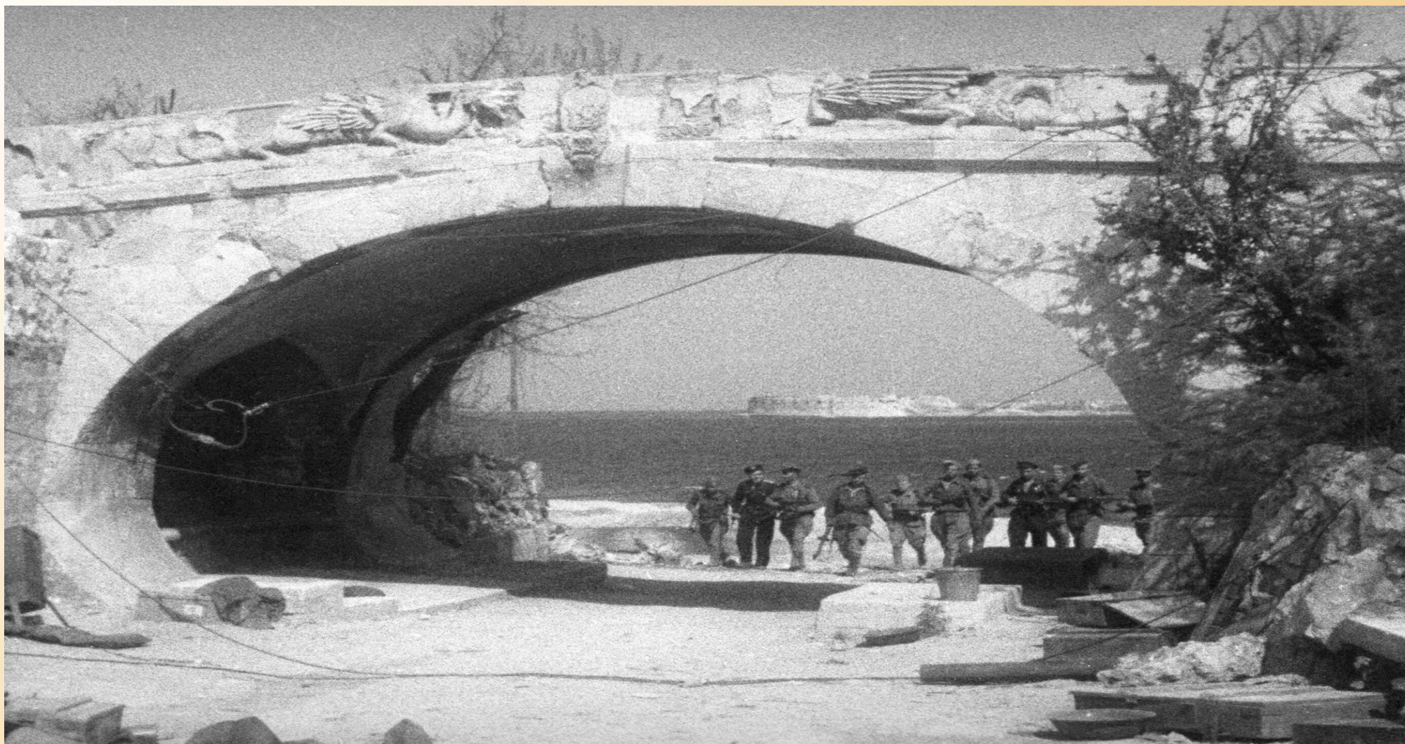
Советские солдаты на Приморском бульваре в освобожденном от фашистов Севастополе