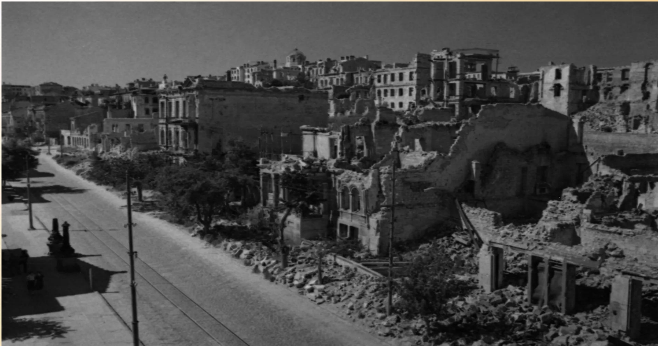
Улица Ленина в Севастополе в первые дни после освобождения города