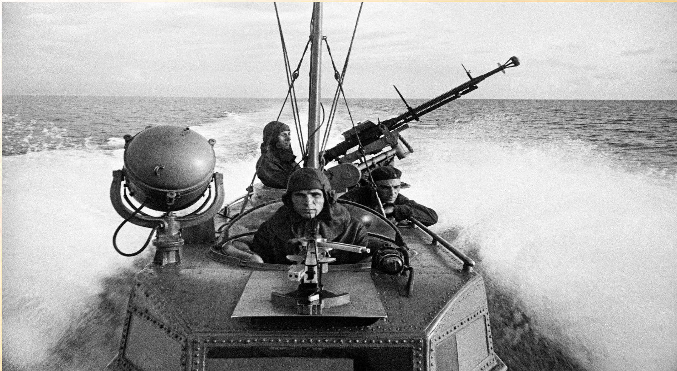
Моряки торпедного катера на выполнении боевого задания